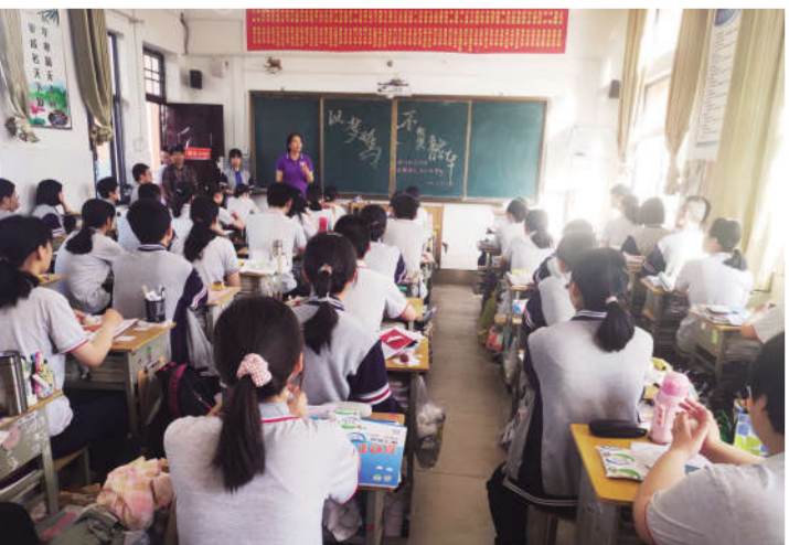
祝福高三 圆梦高考