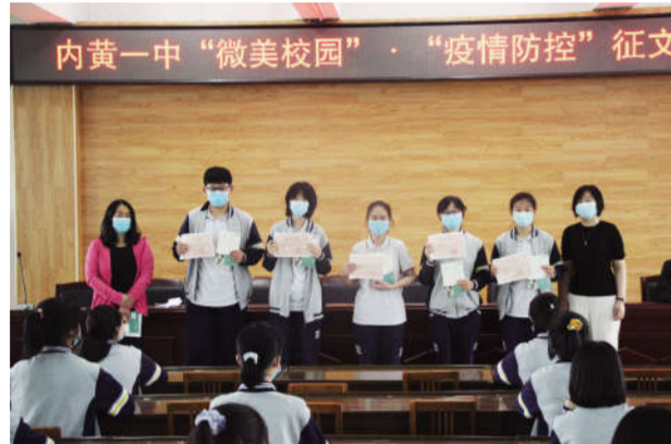
内黄一中“微美校园·疫情防控”征文大赛颁奖典礼