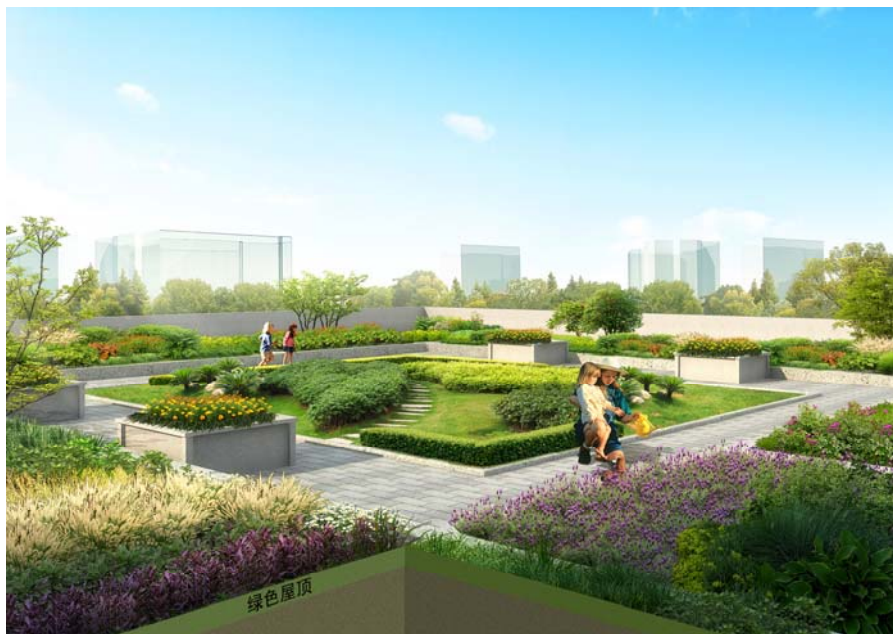
图 7-5 绿色屋顶

绿色屋顶适用于结构安全、符合防水条件的平屋顶和坡度不大于 15^{\circ} 的坡屋顶建筑，优先布置在多层建筑及面积较大的建筑裙楼。