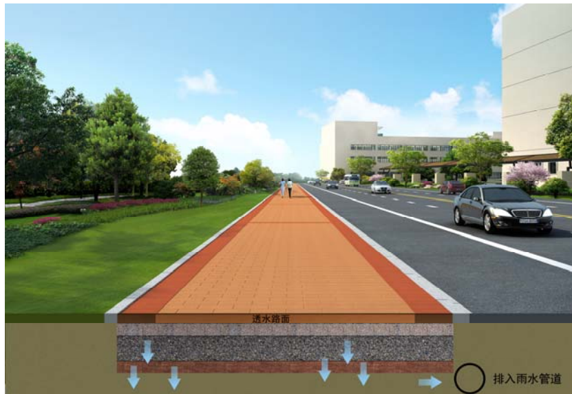
图 7-1 透水路面

7.2.1 透水路面按照面层材料可分为透水铺装路面、透水水泥混凝土路面和透水沥青混凝土路面；嵌草砖、园林铺装中的鹅卵石、碎石铺装等也属于透水铺装路面。