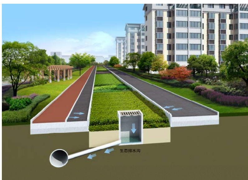
图 7-2 生态滤水带构造图

1 生态滤水带由储水层、滤料层、过渡层和排水层四部分组成。生态滤水带侧面及底部满铺防渗土工布。