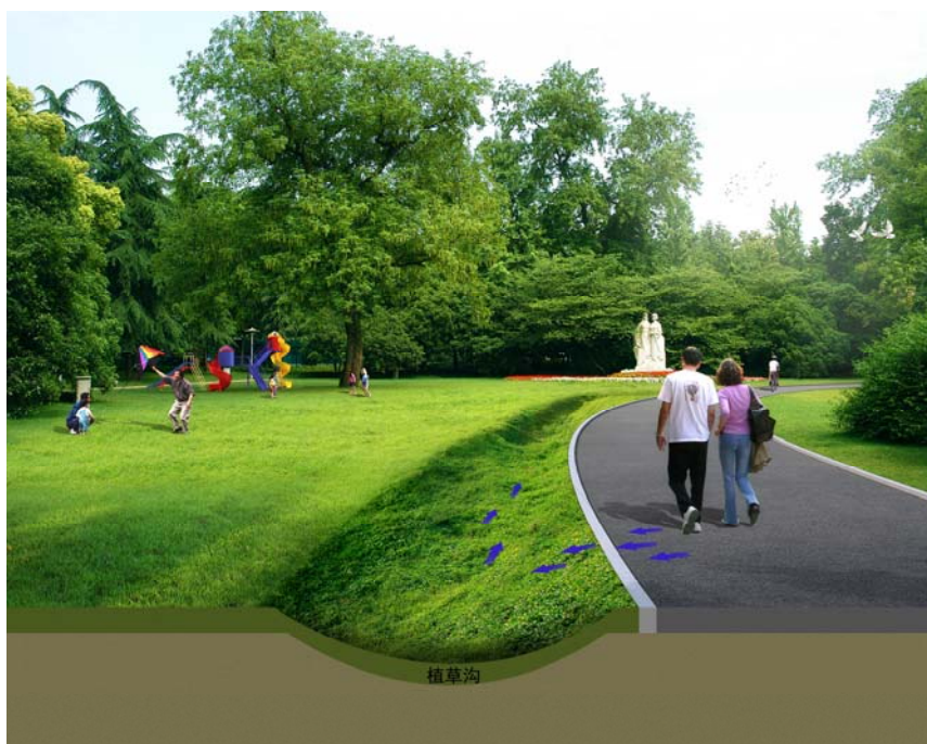
图 7-4 植草沟

植草沟一般分为草渠、干草沟、湿草沟和渗透草沟四类。草渠只用作传输设施；干草沟的种植土层渗透性相对较好，底部埋有渗排管；湿草沟作用与线性浅湿地相似，种植湿地植物，具有较好的污染物去除效果；渗透草沟可大量传输和入渗径流，占地面积较大，通常设置在市郊公路旁边。