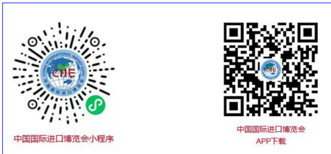
中国国际进口博览会小程序和APP下载二维码

提交方式：参会人员个人， 通过“中国国际进口博览会”APP或微信小程序 ，注册账号并通过人脸识别或手机号验证码，绑定观展证件后，自行提交。（提交系统待开放）