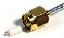
SMA Plug cryogenic coax and RG-405 compatible