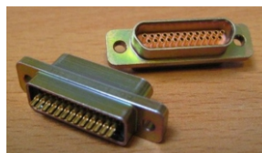
25-way Microminiature-D Plug with sockets