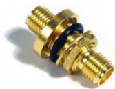
SMA Jack-to-Jack adaptor 密封接头