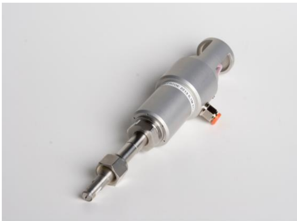
图2 高温高压Ag/AgCl 参比电极 (世伟洛克接头, 母头。其他接头形式可选)