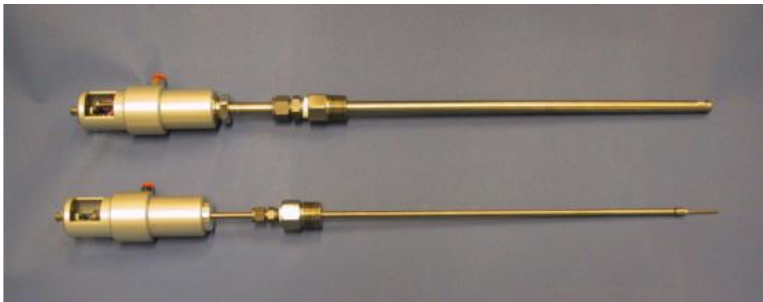
图 3 高温高压参比电极与氧化还原电极（辅助电极）