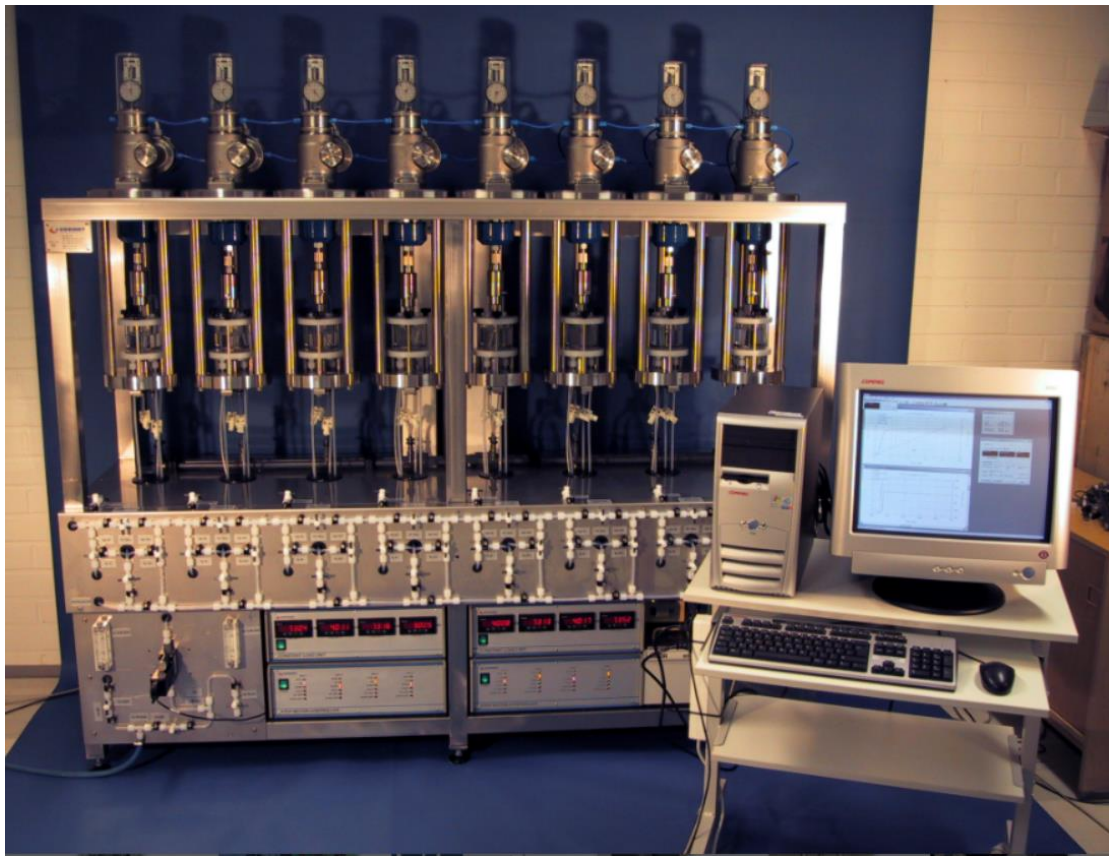
多组慢拉伸 (常温常压)