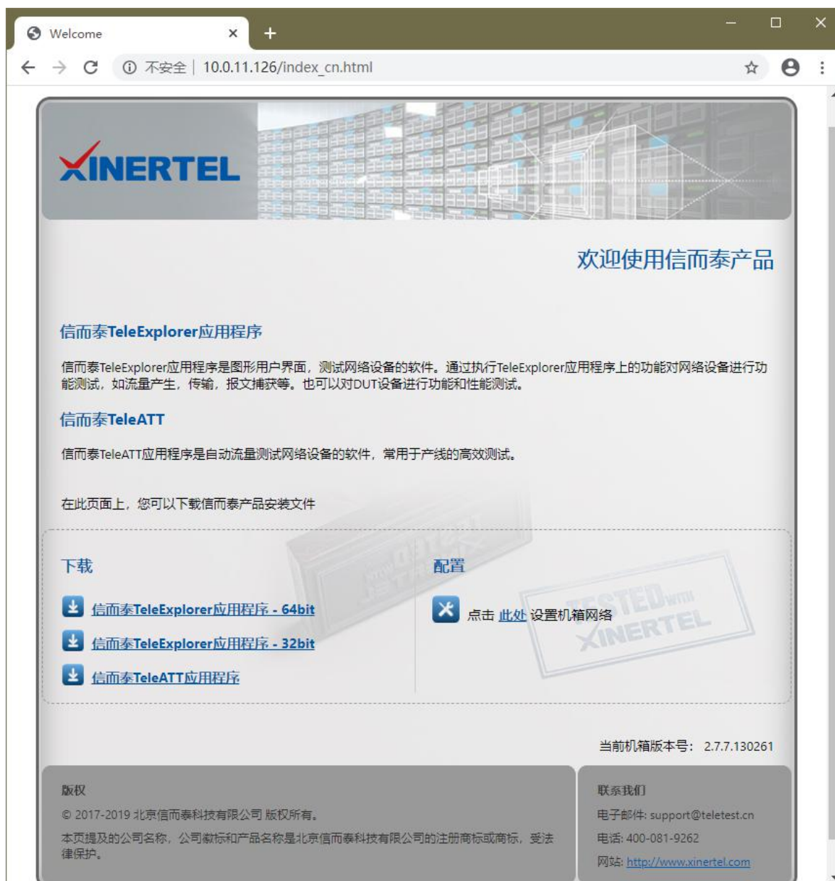
图3 通过 HTML 页面下载测试软件安装文件