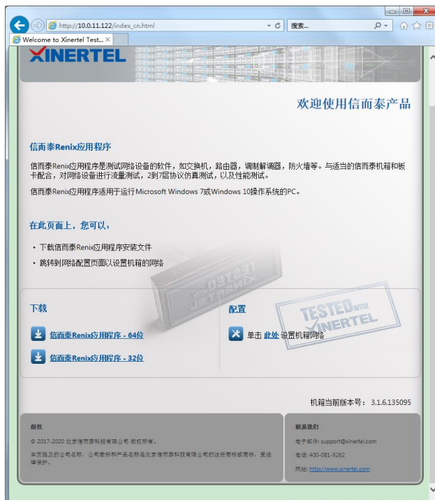
图 3：通过 HTML 页面下载测试软件安装文件