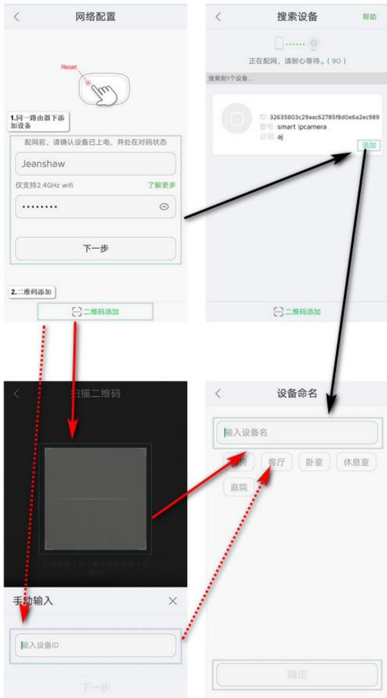
6. 添加设备成功后进入主界面，其各项功能如下图所示。