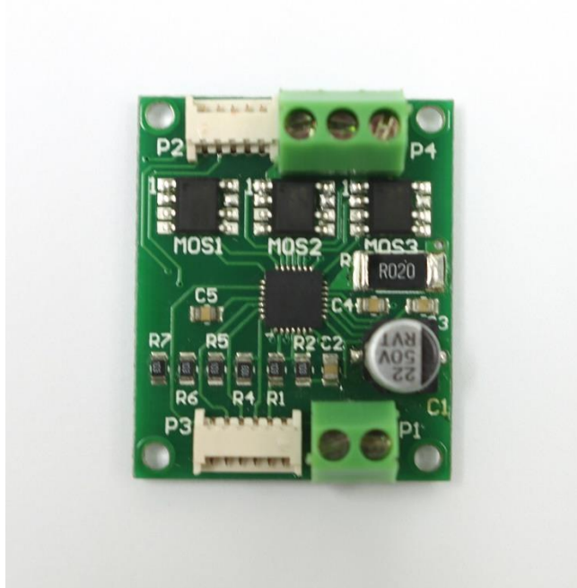
图 3. 速度驱动器 (例)

图中驱动器共有四个接线端口。右下角 P1 端口为直流电源连接口，右侧口连接电源正极，左侧口连接电源负极。左下角 P3 端口为控制信号连接口，从右至左共 6 个 pin 脚，每个 pin 脚在与相应伺服控制器连接后可实现相应的功能，功能表如下。